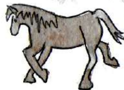
Objetos hechos con recursos renovables