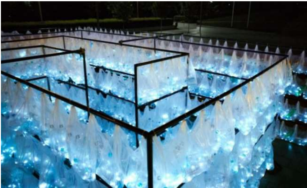
Imagen de la pieza Labyrinth of Plastic de Luzinterruptus

El espectáculo funciona como una instalación abierta durante cuatro horas consecutivas . Cada veinte minutos accede un grupo de diez personas. El recorrido dura aproximadamente 60 minutos y está planteado para que cada grupo pueda transitarlo a su propio ritmo, favoreciendo una experiencia pausada alineada con la idea de lo slow.